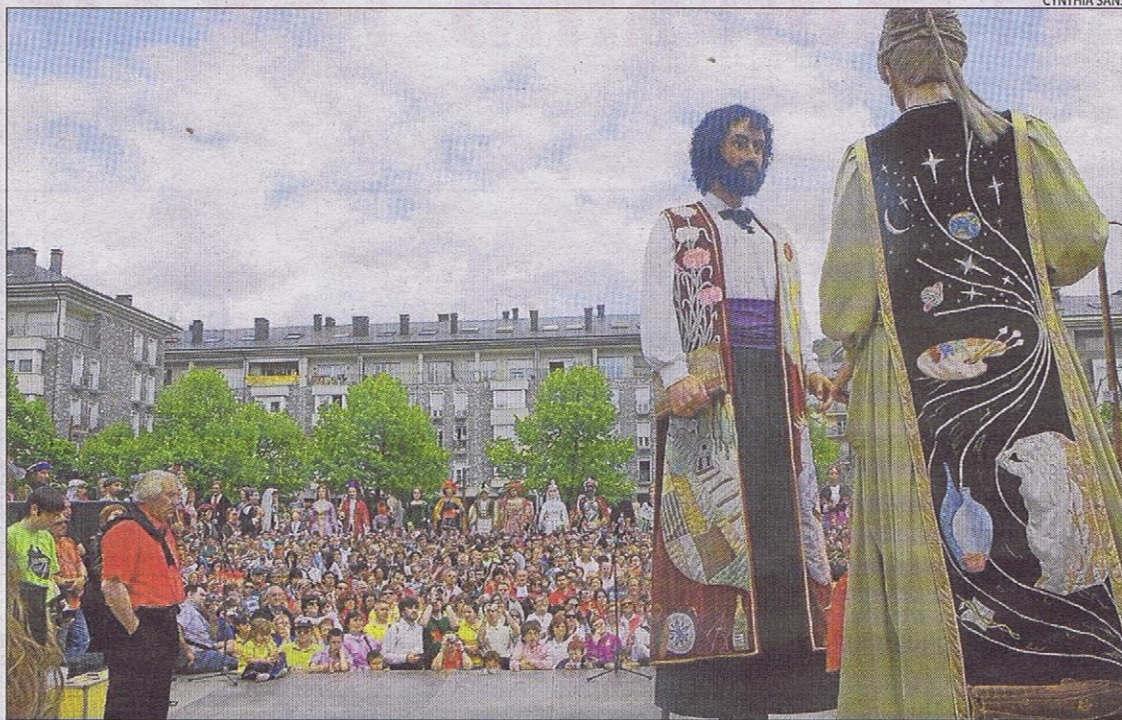
Un dels moments més emotius van ser els balls que van servir per celebrar el traspàs de gegants.

El Treball i la Cultura acompanyaran els gegants de la Seu: l'Ot, l'Urgell, la Constança i l'Abd al-Raman a aquells pobles i ciutats on es desplaçin a favor de la cultura gegantera.